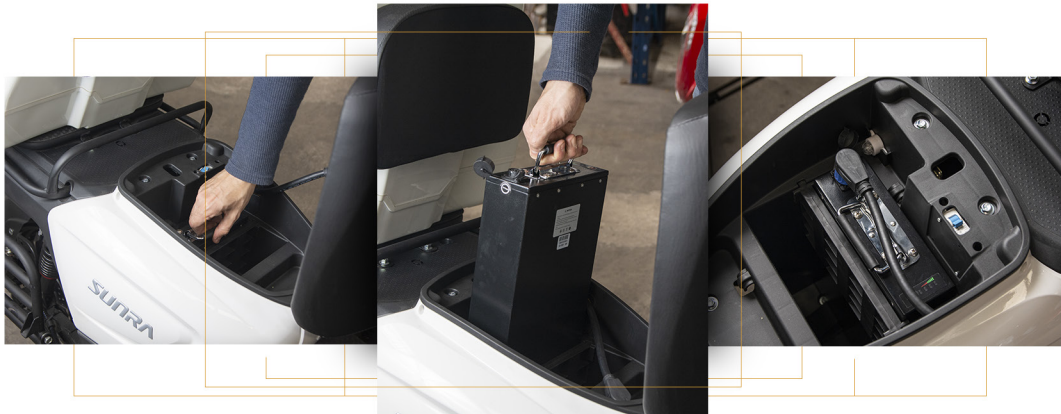
Batería de litio extraíble.

El modelo Caguu puede poseer una o dos baterías de litio de 72V 20Ah. En el primer caso, la autonomía máxima del vehículo llega a 65 kilómetros mientras que, en el segundo, a 130. Las baterías son extraíbles y cuentan con hasta 1500 ciclos de carga.